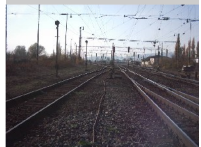
Bahnlinsen zerschneiden das Gebiet