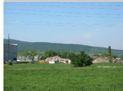
Blick zum Ortskern