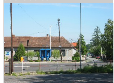
typisches Haus in Alt-Rača