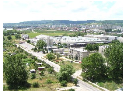
Aufgegebene Lagerhalle und Kleingartenanlage

Einige großmaßstäbliche Projekte sind in Rača bereits angelaufen. Beispielsweise entwickelt das Bratislava-