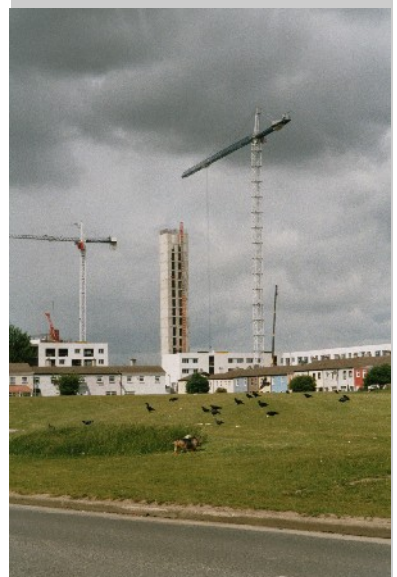
Freifläche in Ballymun