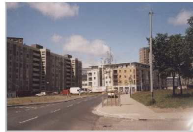
Alte und neue Strukturen