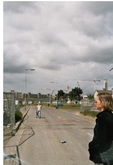
Blick zur Baustelle