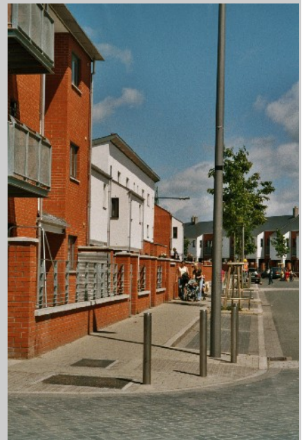
Neu gestalteter Platz

LUDA is a research project of Key Action 4 "City of Tomorrow & Cultural Heritage" from the programme "Energy, Environment and Sustainable Development" within the Fifth Framework Programme of the European Union. http://www.luda-project.net